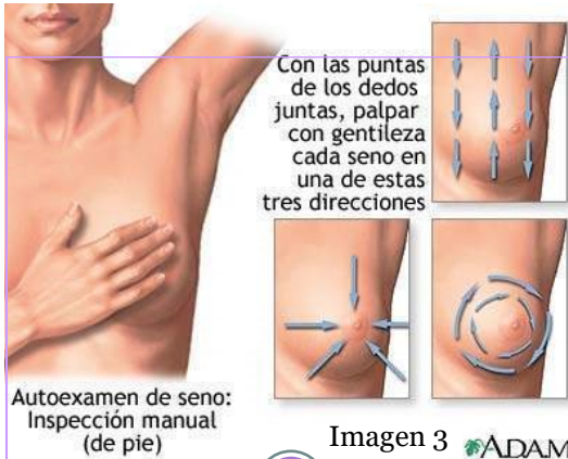
Autoexamen de seno: Inspección manual (de pie)